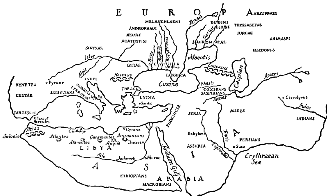
1-карта – Геродоттың Әлем картасы

Ұлы Жібек жолының күре тамыры саналған бұл атырапта бір кездері қалалық мәдениет жақсы дамығанын осы өңірде тығыз орналасқан тарихи-мәдени ескерткіштерден көре аламыз. Көптеген тарихи оқиғалардың куәсі болып, бір кездері Кенджида, Тарбанд-Фараб, Шаш, Шавгар уәлаяттарына бөлінген ұланғайыр атырап қазіргі таңда Шардара, Арыс, Отырар, Түркістан сынды әкімшілік-аумақтық бөліністерге бөлініп отыр.