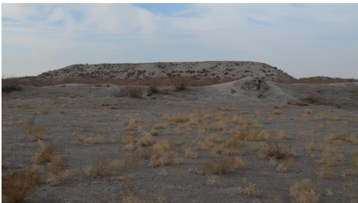
7-сурет – Байыркұм қалажұртының әуеден көрінісі

Байыркұм салыну формасы күрделі, айналдырыла ормен қоршалған үлкен рабады бар қала орны болып саналады. Рабады орымен қоса алғанда 287х396 м. Рабадты қоршап жатқан орының ені 15–19 м аралығында. Ішкі қамалы рабадтың оңтүстік-шығысына таман орналасқан. Формасы төрткүл тәріздес етіп салынған орталық айналдырыла ормен қоршалған. Ішкі қамалдың қорғандары айналдырыла 8 мұнарамен бекітілген. Ішкі қамалдың солтүстік-батысында көлемі 60х182 м келетін су қоймасы орналасқан (7-сурет). Жинақталған материалдарға қарағанда, б.з.б. I ғасыр мен б.з. VIII ғасыры аралығында салынған қала екендігі белгілі болған.