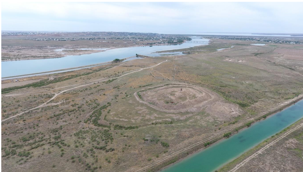
4-сурет – Шардара қалажұртының әуеден көрінісі