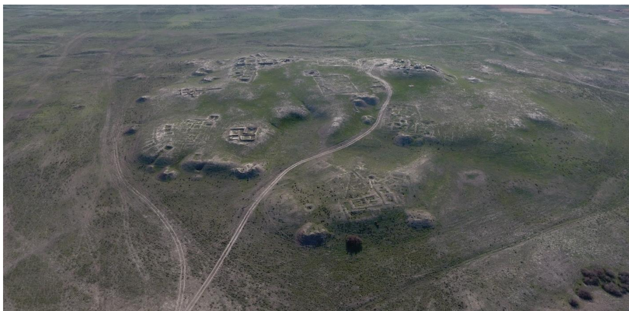
3-сурет – Кедер (Құйрықтөбе) қалажұртының әуеден көрінісі

Кедер қаласын X ғасырда оғыздар салған және бұл қала Отырар (Фараб) қаласымен жарыса кеңейіп өсті [4, 21-б.; 7, 37–38-бб.]. Кедер қалажұртының астаналық дәрежеде болғанын әл-Истахридің 933 ж. шамасында жазылған «Жолдар мен елдер» атты еңбегінен де кездестіруге болады. Аталған еңбектің XI–XII ғғ. жасалған парсы аудармасында «Кедер Фарабтың бас қаласы... Васидж де Фараб қалаларының бірі ... Фараб бұл өлкенің аты. Оның ұзындығы бір күндік жол. Алайда барлығы бекіністі. Өлке таулы болып келеді. Оның шетінде Шаш өзенінен суландырылатын жазық бар» деген құнды мәліметтер сақталған [8, 56–58-бб.]. Құйрықтөбе сонымен қатар, Отырар өңірінен анықталған ең ежелгі мешіттің табылуымен де танымал болып отырған қала.