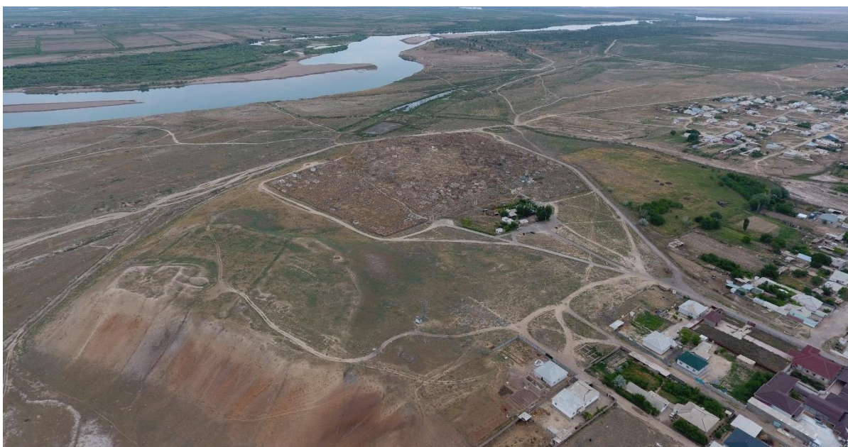
5-сурет – Жаушықұм қалажұртының әуеден көрінісі