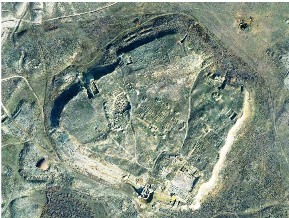
1-сурет – Отырар қалажұртының әуеден көрінісі

Арабтілді деректерде Тарбанд Шаш мемлекетінің астанасы деп жазылады. Тарихшы әл-Белазури Самарқанды 712 жылы арабтардың жаулауын айта келіп: «Самарқанды Құтып (Кутейба) қоршап алып, бірнеше рет текетірес қақтығыстар болды. Соғды патшасы Тарбандта тұратын Шаш патшасына хат жазды» деп жазды [4, 14-б.]. Бұдан VII–VIII ғғ. аралығында Тарбанд, Шаш уәлаяттары біртұтас мемлекет болғанын білуге болады.