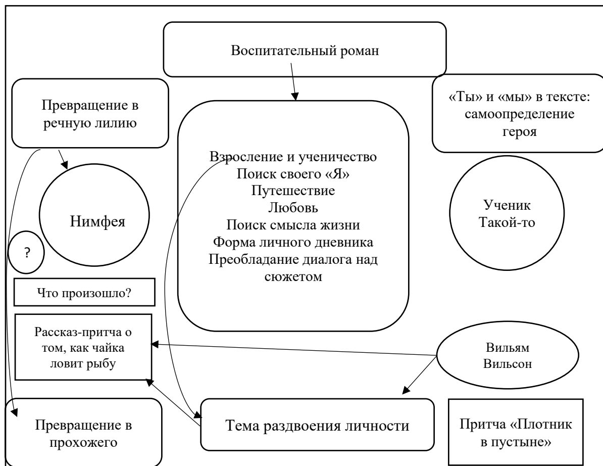
Схема 2 – Кейс «Школа для дураков» – роман воспитания. Главный герой романа – Ученик Такой-то»

2. «Школа для дураков» – пародия на поджанр романа воспитания. Главный герой романа – Нимфея. Мотив трансформации (точка зрения Сысоевой О.А., тезисы Баранова Д.К.).