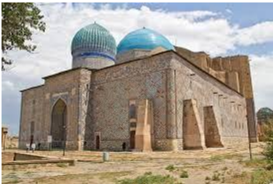
5-сурет – Қабірхана және кіші мешіт бөлмесі

Терракота – күйдірілген саз балшық деуге болады. Осы саз балшықты күйдіру негізінде жасалған керамикалық боялмаған, шыңылтырланбаған, түрлі-түсті саз балшықтан жасалған құрылыс материалдарын қолданған. Орта ғасырларда кесіп өрнек түсірілген терракота Орта Азияда сәулет өнерінде кең қолданылды.