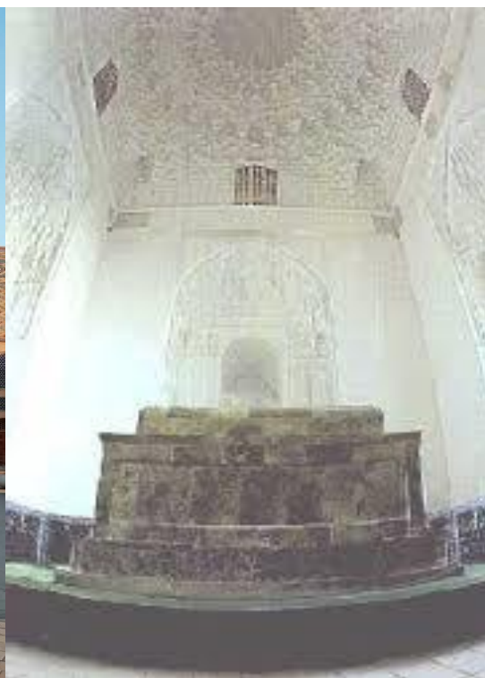
2-сурет – Қабірхана бөлмесі. Ішкі бөлігі.