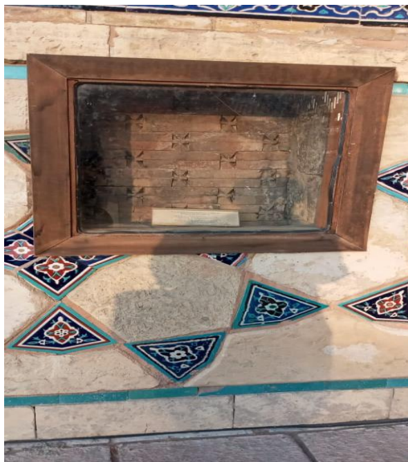
4-сурет – Қазіргі кезеңдегі Қабірхана бөлмесінің XII ғ. көне қабырғасының көрінісі

XIV ғасырда Әмір Темір кесенені салдырғанда XII ғ. қабірлердің орнының жоғалмауына көңіл бөлген (4-сурет). Ғалымдар зерттеуіне сүйенгенде XII ғ. қабірлер үшін арнайы қуыстар қалдырып кетіп отырған және шырақтар жағылған, яғни шырақханалар болған [7, 9-б.].