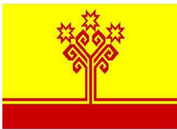
29 сәуір 1992 жылғы мәжілісте қабылданған Чуваш Республикасының Мемлекеттік туы (URL 3)

1997 жылы 14 шілдеде Чуваш Республикасының Мемлекеттік Мәжілісінде Чуваш Республикасының Мемлекеттік рәміздеріне байланысты заң қабылданды. Ресей Федерациясының қарамағындағы ел ретінде Чуваш Республикасының рәміздері болып Чуваш Республикасының Мемлекеттік туы, Чуваш Республикасының Мемлекеттік Елтаңбасы және Чуваш Республикасының Мемлекеттік Әнұраны белгіленді (URL 5). Чувашияның Мемлекеттік елтаңбасы мен туының авторы – Элли Михайлович Юриев 1 (1936-2001).