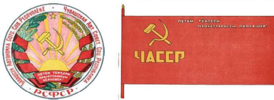
Чуваши АССР-нің 1931-1937 жылдар арасындағы мемлекеттік елтаңбасы және туы [1, 444-б.] (URL 3)

Ал ту болса қызыл түсті кеңістіктің бетіне айшықталған. Тудың сол жақ бұрышында тіктөртбұрышты кеңістік бар және осы кеңістіктің айналасы чуваш халқының ұлттық нақыштарымен өрнектелген. Тіктөртбұрышты кеңістіктің іші ақ түсті болып, оның ортасында Чуваш Автономиялық Советтік Социалистік Республикасының әрі чуваш, әрі орыс тілдеріндегі қысқа атауы ЧАССР және оның үстіңгі сол жақ бұрышында орақ пе балға салынған.