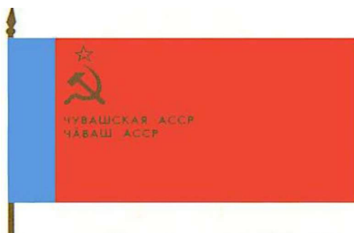
Чуваш АССР-нің 1954 жылы қабылданған туы [1, 444-б.]

1954 жылы тағы да өзгертілген тудың қызыл бөлігінің сол жағына жоғарыдан төмен қарай ашық көк түсті бөлік қосылды. Қызыл кеңістіктің сол жағының үстіңгі бөлігіне орақ, балға және жұлдыз орналасты. Оның астында да автономиялық республиканың чуваш және орыс тілінде жазылған Чувашская АССР және Чăваш АССР сөздері жазылды.