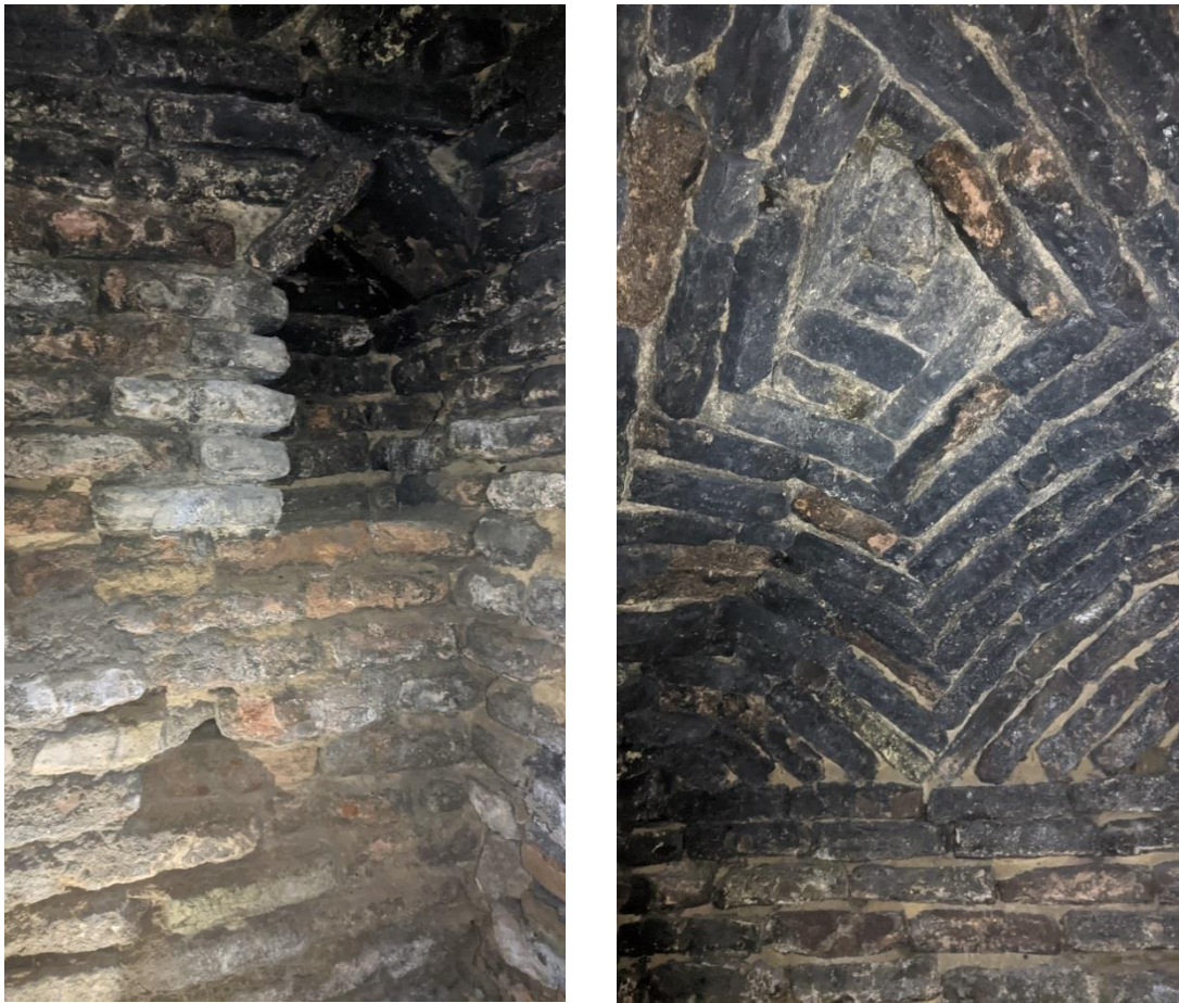
Рис. 3. Фрагменты интерьера подземной кельи.