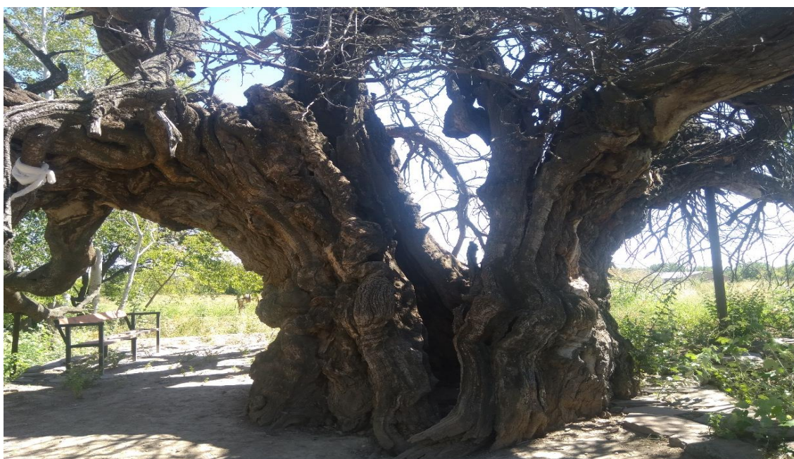
Рис. 5. Старинное шелковичное дерево-тут.

Салиха отмечается: «Благословенная могила Хазрата Арслан Баб в той местности, вблизи реки Сайхун [расположено] и это место паломничества всех тюрок Дашт-и Кипчака. Обычно купцы этих областей там останавливаются, чтобы совершить паломничество и просить помощи и благословения от той святой особы» [16, 391]. Место погребения Арыстанбаба стало местом паломничества еще при жизни Ходжа Ахмеда Ясави. В «Насаб-нама» (редакций «Кара-Асман») говорится, что после смерти Арыстанбаба «Йасави Ахмад-хаджа ходил на паломничество его могилы в Уtrar» [1, 229]. В ходе проведения реставрационных работ 2004 году, в помещении гурханы при углублении на 35 см относительно ее современного уровня пола были выявлены остатки строительных конструкции ранней постройки. В 2,1 м от юго-восточной стены, в 2,8 м от северо-западной стены гурханы, на глубине 12 см от поверхности пола был обнаружен угол остатков древнего надгробия из жженных кирпичей прямоугольной формы, сохранившаяся на высоту 4-5 рядов кладки. Размеры кирпичей варьируют между 18 x 9 x 3,5 см, и 19,5 x 15,5 x 4,5 см. Из подобных кирпичей была сложена соборная мечеть на городище Куйруктобе, датируемая X–XII веками. Полученные археологические данные позволяет считать, что ранний надгробный памятник Арыстанбаб был сооружен в период караханидов.