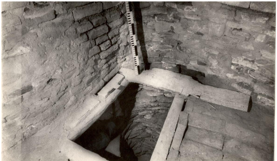
Рис. 2. Вход в поземную келью. Фото 70-х гг. XX в.

В публикации мечеть Хильвета с подземной кельей обозначено как Центральное помещение (1) в плане подквадратное (5,9 x 5,5 x 5,2 м) с михрабом в середине западной