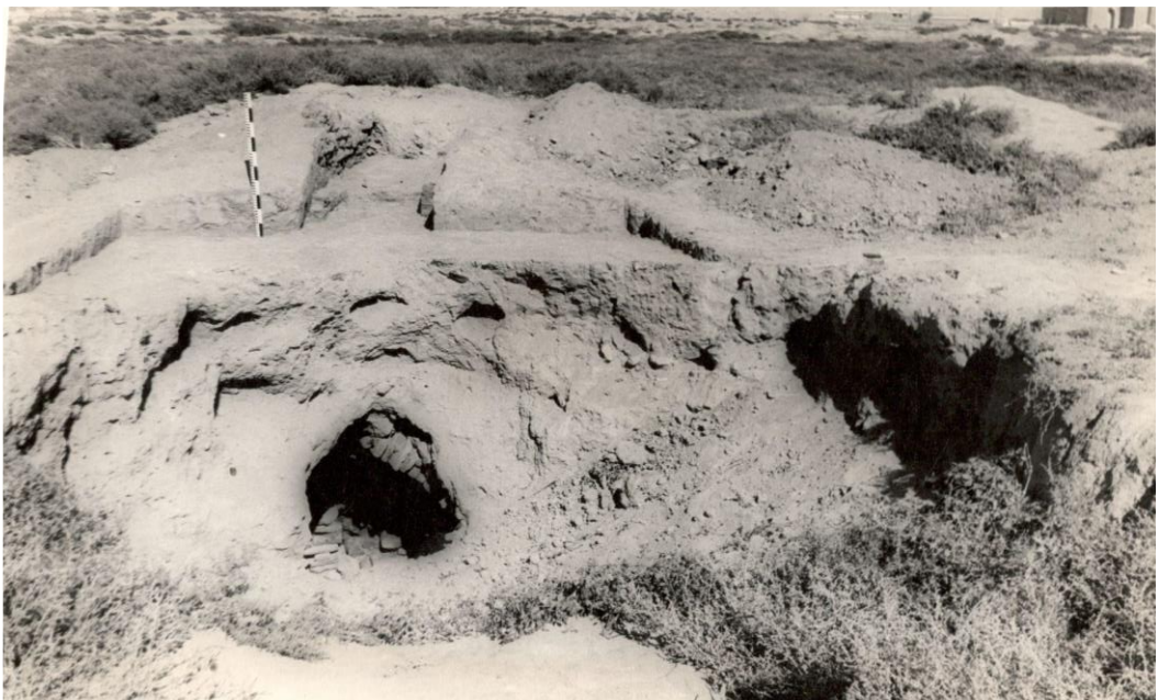
Рис. 4. Фото 70-х гг. XX в.

Одним из главных мусульманских святынь Казахстана является мавзолей Арыстанбаба, который располагается в 3 км от центральных развалин древнего Отрара (в 12 км от Шаульдера – современного центра Отрарского района Туркестанской области). В историческом сочинении конца XIX века «Тарих-и джадида-йи Ташканд» Мухаммад-