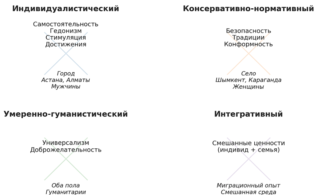
Рисунок 3 – Типология ценностных установок студентов Казахстана (в условиях урбанизации)

Таким образом, предложенная типология подтверждает сложную, неоднородную и многослойную структуру ценностного поля студенческой молодёжи Казахстана. Она демонстрирует, что ключевые социокультурные параметры – происхождение, регион, гендер и образовательная среда – выступают значимыми факторами, детерминирующими специфику смысловых ориентиров. Одновременно с этим выявлена и общая тенденция к гуманизации, что позволяет говорить о наличии универсального ценностного ядра, формируемого под воздействием образовательной среды и процессов модернизации.