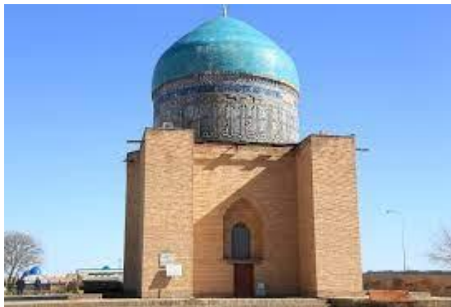
1980 ж. кейінгі қайтадан қалпына келтірілген Рәбия Сұлтан бегім кесенесі