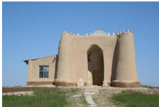
5-сурет – Көк тонды ата кесенесі [20]