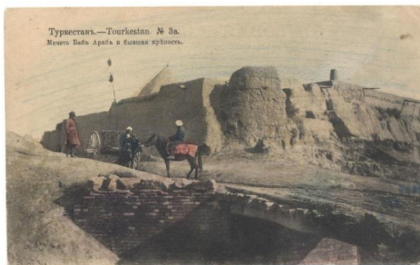
2-сурет – XX ғ. 1910 ж. Түркістан қ. Бабырат көпірі, Баб араб кесенесі, мешіті, Жеті ата қақпасы. [4]

Қазақтардың тұрғын үйлерін, сәулет өнерін зерделеген Ө. Жәнібеков қазақ жерінде түрлі себептермен діни ғибадаттық сәулет ескерткіштерінің көп сақталғанын, олардың көбі күмбезді болып келгенін, ал күмбездердің тұрғын үйдің жылжымалы түрлері – киіз үйге ұқсағанын айтқан [4]. Осы ретте ғалым Баба-әже қатын күмбезіндегі шатырлы жабынды, кейіннен дарбазалы-күмбезді сәулет өнерін дамытуға кең қолданылғанын талдайды. Қазақ халқының баспанасын зерттей отырып, шатырлы жабынды, дарбазалы-күмбезді сәулеткерлікті А.Н. Бернштамның кейіннен бүкіл Орта Азия сәулет өнерінің өзегі болғанын, үш белгі – құрылыстың күмбезді қаңқасы, портал мен ойма қыштардан құрастырылатын өрнекті екенін бөліп қарап, күмбез идеясы, оны тұтас жүзеге асыру көшпелі малшы қауым мекендеген қыпшақ даласынан алмасқанын айтады [4, 29-б]. Орта Азия сәулеттік құрылыстарын зерттеген ғалымдар жерлеу құрылыстарын зерттеуде Орта Азияға тән өзіндік бір ерекшеліктерін анықтаған.