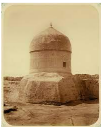
Түркістан альбомынан. 1895 жылға дейінгі Рәбия Сұлтан бегім кесенесі

1866 жылы Түркістанда болған П.И. Пашино өзінің жолжазбасында 1864 жылы жаз айында кесене қабырғасын зеңбірек оқтарымен атудың нәтижесін, ондағы ойықтардың кесененің көркін бұзып тұрғанын жазады. Жазбасында Әзірет Сұлтан кесенесіне көпір арқылы өткенін баяндайды (2-сурет). Ол кезде Рабия Сұлтан бегімнің кесенесі қару-жарақ қоймасы ретінде қолданылып, кілттеліп қойылғаны баяндалады (3-сурет). Түркістанға орыс әскерлері келгеннен кейін 1864 жылдан соң, Қожа Ахмет Ясауи кесенесі әскерилердің азық-түлік дүкеніне, Рәбия Сұлтан бегім мазары қоймаға айналған [3]. Кесененің оңтүстігінен 75 м жерде орналасқан Рәбия Сұлтан бегім мазары 1895 жылы құлаған.